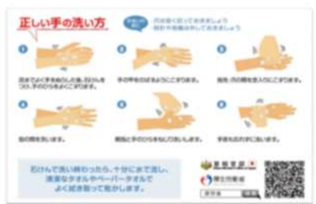
出典「学校における新型コロナウイルス感染症に関する衛生管理マニュアル」より